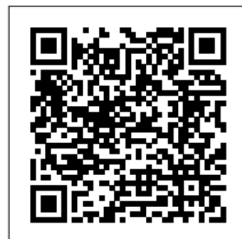
Link als 2D Barcode für Handy

Den Link finden Sie unter der Homepage der Gemeinde Hainsfarth: www.hainsfarth.de oder über den QR-Code.