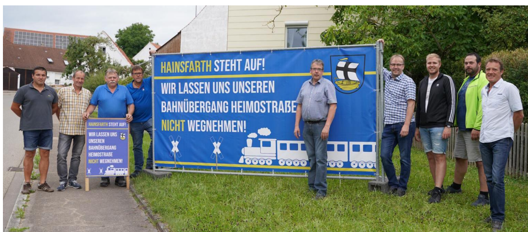
Der Gemeinderat Hainsfarth beim Aufstellen der Banner.

Aufgrund der Corona-Pandemie konnten wir die bereits im März 2020 geplante Kampagne erst jetzt starten. Durch das Aufstellen der Banner und Plakate hat die Gemeinde Hainsfarth den Startschuss für weitere Maßnahmen gegeben.