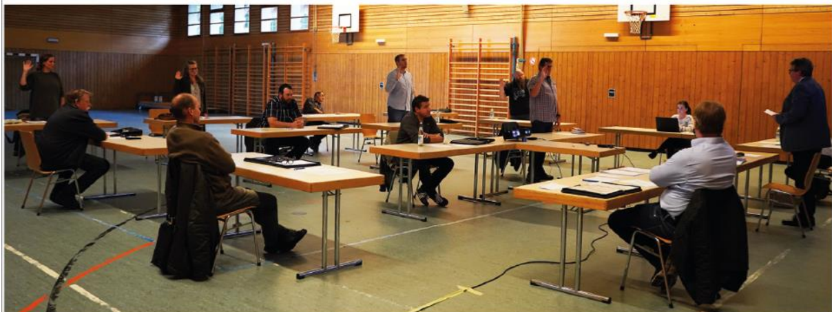
Vereidigung der neuen Gemeinderäte